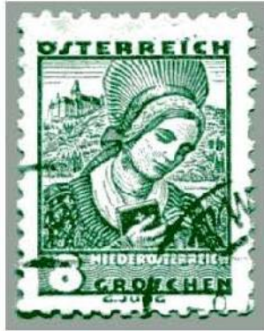
Kirchgang von der Rosenburger Hofmühle nach Altenburg (8-Groschen-Briefmarke, 1934)

mit der Auflösung der Pfarre Horn-Riedenburg – ihre Pfarrkirche befand sich unweit der Horner Kaserne, wo Reste ihrer Grundmauern die Einfriedung des 1873 errichteten jüdischen Friedhofs bilden – und der Gründung der Pfarre Maria Dreieichen, als der