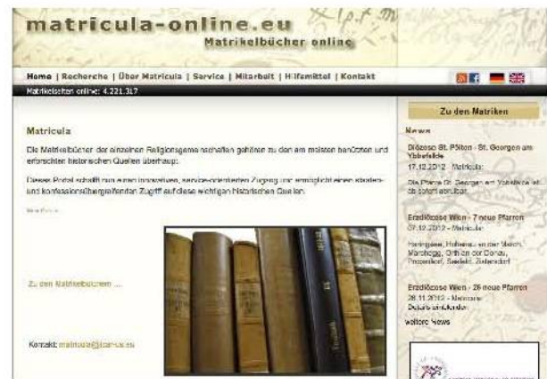
Startseite von www.matricul-online.eu .

Seit 2012 sind die digitalisierten Original-Matrikeln der heutigen Diözese St. Pölten im Internet unter http://www.matricul-online.eu zugänglich. Viele von ihnen haben Personenregister bzw. eigene Personenregisterbände, die die Suche nach bestimmten Personen erleichtern. Die anmeldungspflichtige, aber kostenlose Website http://www.genteam.at bietet zusätzliche Hilfe. In ihren Datenbanken werden die Personendaten aus den Matrikeln fortlaufend erfasst und sind so leicht elektronisch recherchierbar. Die Garser Matrikeln sind beispielsweise schon größtenteils erfasst. Einschränkungen bei der Nutzung beider Angebote ergeben sich lediglich aus dem datenschutzrechtlichen Bestimmungen des Personenstandsgesetzes.