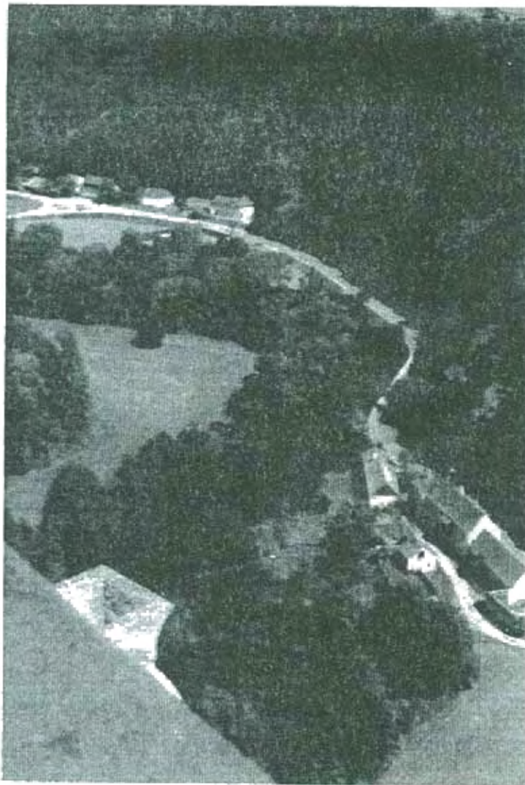
Das Kampal vom Bergfried der Rosenberg aus aufgenommen, September 2000. Im Vordergrund die Tempelwiese, dann das Hauerhaus und links die Siedlungsinsel um das Gasthaus Hutecek.