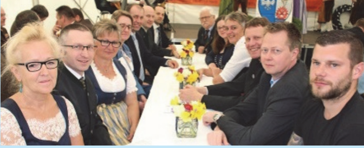
Gemeinderäte der Gemeinde Rosenberg-Mold