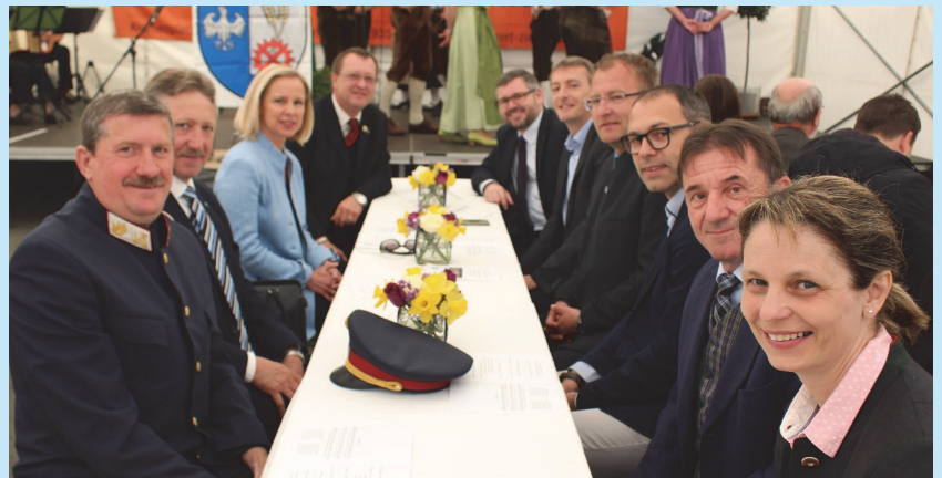
Vertreter der öffentlichen Stellen am Ehrentisch