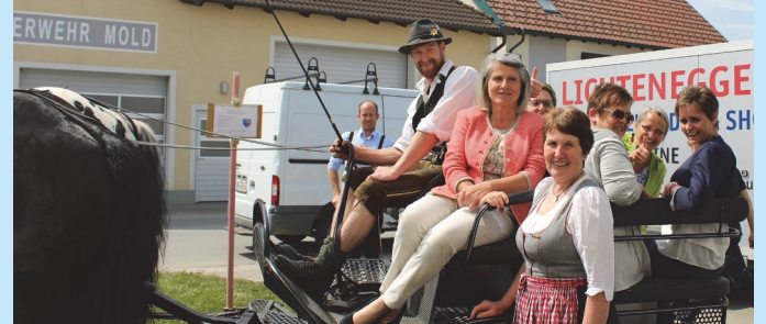
Der Kutscher fuhr die Damen durch Mold