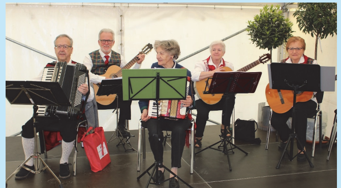
Begleitmusik der Volkstanzgruppe