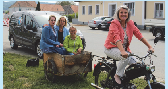
Einst & Jetzt: Das neue E-Auto der Gemeinde und das außer Dienst gestellte Moped